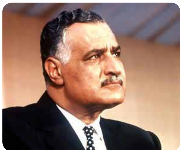
الزعيم العربي كان لديه رؤية إقتصادية افتقدتها جميع الرؤساء الذين خلفوه في مصر و في الامة العربية

باستصلاح الأراضي، هذا وقد عمل عبد الناصر على إنشاء المشروعات الصناعية ذات الأهمية الكبيرة وعلى رأسها صناعات الحديد والصلب كما عمد عبد الناصر في إنشاء هذه المشروعات على التمويل الذاتي دون الحصول على قروض أجنبية أو معونات، كما تم إنشاء شركة